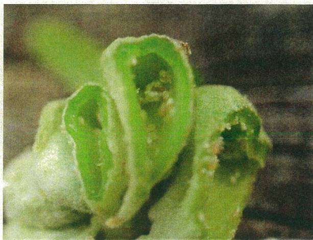
エゴネコアシアブラムシによる虫こぶと中の幼虫