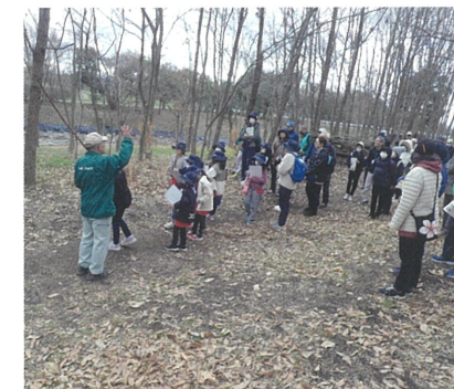
森のなかの自然観察