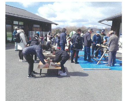
シイタケの菌打ち