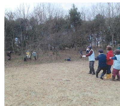
力をあわせて伐採