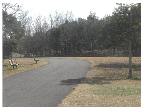
つどいのゾーン、地球広場をみる