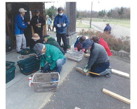
ノコギリの手入れ

また、3月2日の活動には、森づくりサポーター23名、ガールスカウト17名、計40名の皆さんが参加しました。セミナールームでの開会式のあと、「森で春を見つけよう」をテーマにした自然教室で、梅の花やネコヤナギの新芽などのほか、アベマキやクヌギなどの樹皮を観察しながら自然観察ノートに記録し、春の訪れを感じていただきました。