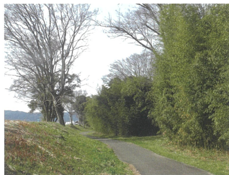
ふるさとゾーン、竹林へ向かう